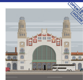
19.—20. května 2018 Festivalový katalog